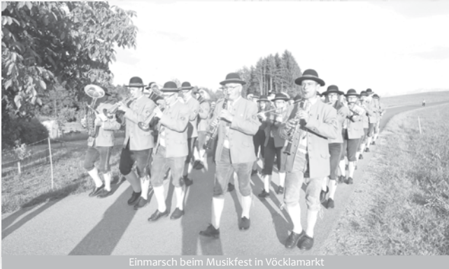
Einmarsch beim Musikfest in Vöcklamarkt

So ist es auch unsere Aufgabe, die Tradition der Musik in Bewegung zum Vergnügen des Publikums weiterzuführen. Musik in Bewegung – dieser Begriff hat sich in den letzten Jahren gegenüber dem der Marschmusik durchgesetzt. Wir wollen damit zeigen, dass Musik im Gleichschritt mehr sein kann als bloßer Rhythmus für diverse Umzüge. Aufwändige Showeinlagen, komplizierte Figuren oder auch nur die koordinierten Bewegungen der Musiker zu ihrer eigenen Musik erfordern ein gewisses Maß an Übung und Training. Vom Einstudieren des musikalischen Teils über die richtige Instrumentenhaltung und die Bedeutung der Kommandos und Zeichen des Stabführers.