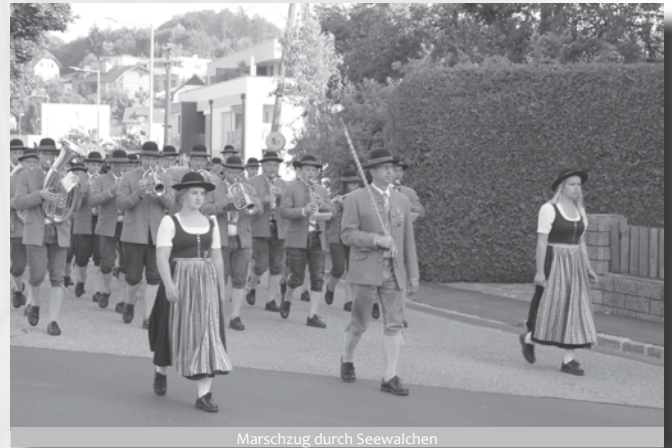
Marschzug durch Seewalchen

Dies gelang uns auch am 16. Juni 2018 beim Bezirksmusikfest in Neukirchen an der Vöckla. Die Marktmusikkapelle Seewalchen erreichte mit ihrem Showprogramm wieder einen ausgezeichneten Erfolg in der höchsten Leistungsstufe. Als Stabführer bin ich daher auf die Leistungen unserer Musikerinnen und Musiker sehr stolz, da für die Wertung 8 Marschproben abgehalten wurden und das bei einem bereits sehr straffen Terminkalender.