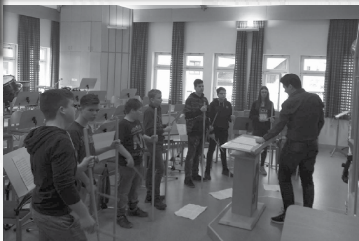
Intensive Probenarbeit für das Jugendkonzert von „ATTGASEEWISW“