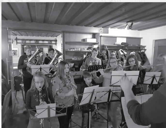
Das „verjüngte“ JBO bei der musikalischen Umrahmung der MMK-Weihnachtsfeier

Wir haben auch dieses Jahr wieder viel erlebt und freuen uns auf die kommenden Herausforderungen, insbesondere auf das Gemeinschaftsprojekt gemeinsam mit Attersee und Gampern.