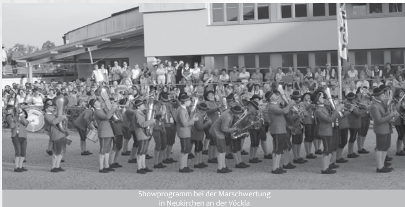
Showprogramm bei der Marschwertung in Neukirchen an der Vöckla

Diese Marschmusikbewertung findet heuer am 14. und 15. Juni in Zipf statt. Das Brauereigelände ist ein einmaliges Ambiente für den Einzug der vielen Kapellen und den Showprogrammen, die geboten werden. Es lohnt sich sicher wieder vorbeizuschauen.