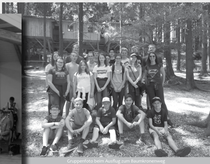
Gruppenfoto beim Ausflug zum Baumkronenweg