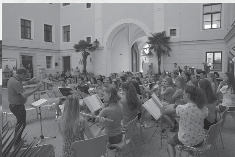
Abschlusskonzert vom Musiklager in Lambach