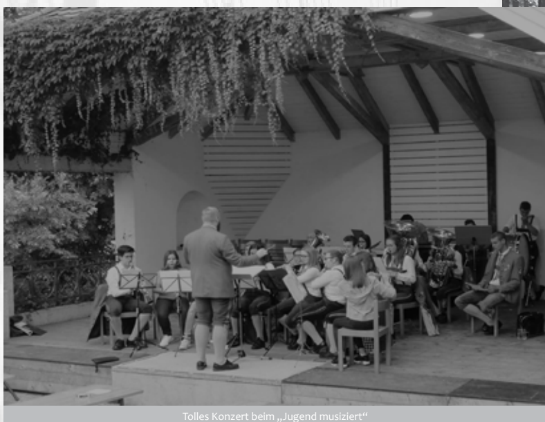
Tolles Konzert beim „Jugend musiziert“

Am 11. Juli war es dann so weit: „Jugend musiziert“ stand vor der Tür. Bei dieser Veranstaltung dürfen unsere jungen MusikerInnen eine Stunde vor Beginn des Abendkonzerts der MMK ihr Können unter Beweis stellen. Diesmal war es auch für uns Dirigenten besonders spannend, weil wir mit dieser (kleineren) Besetzung bislang kein Konzert bestreiten durften. Die Anspannung wich jedoch schnell und wir konnten zeigen, dass sich die Proben ausgezahlt hatten. Das Konzert war ein voller Erfolg und natürlich auch ein Ansporn für zukünftige Auftritte.