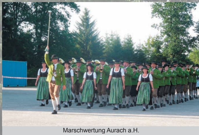
Marschwertung Aurach a.H.

Nach nur einer Woche Verschnaufpause machten wir uns auf den Weg nach Bruck an der Mur. Wir waren eingeladen, mit zahlreichen Musikkapellen sowie der Gardemusik Wien eine Rasenshow im Murinsel-Stadion vor 2000 Besuchern zu präsentieren. Zum Abschluss erfolgte das gemeinsame Konzert aller Musikkapellen. Ein Fest der Musik das wieder einmal beweist „Musik verbindet“ . Das Ambiente und die mitreißende Stimmung wird uns allen bestimmt lange in Erinnerung bleiben.