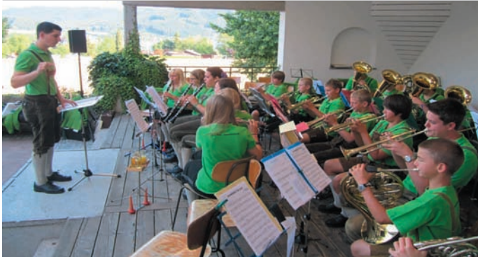
Abendkonzert & Jugend musiziert

Weiter ging es dann am 18. Juli 2013 mit dem ersten Abendkonzert im Pavillon Seewalchen, das, so wie jedes Jahr, unter dem Motto „Jugend musiziert“ stattfand. Dort oblag dem Jugendorchester die Eröffnung des Abends.