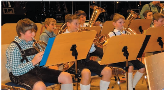
Jugendorchester Musikerball 2013

Die Sommerferien wurden dann am 07. Juli 2013 mit dem Jugendorchestertreffen in Pilsbach eingeleitet. Dort trafen sich Jungmusiker aus Atzbach, Bruckmühl, Pilsbach, Puchheim und natürlich Seewalchen und durften dort ihr Programm präsentieren.